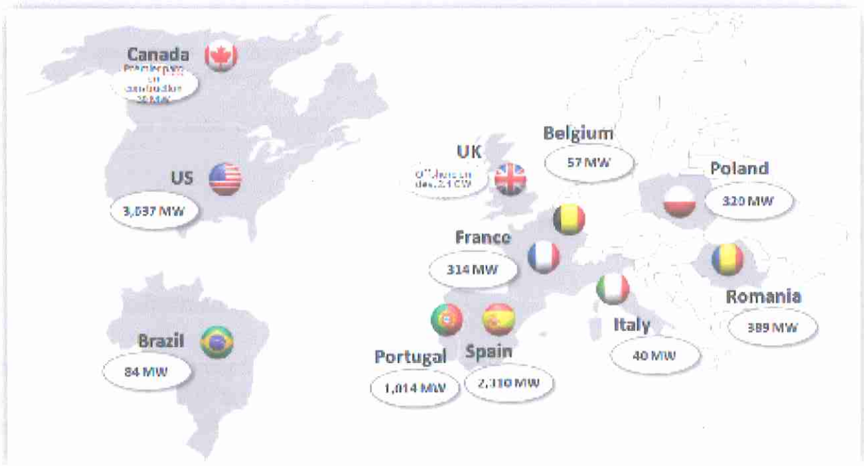
Figure 13 : Répartition par constructeur de la puissance éolienne raccordée totale en France au 1 er juillet 2014

EDPR continue d'étendre ses activités à travers le monde.