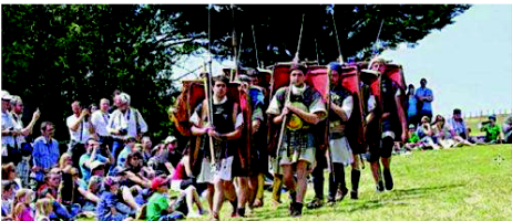
Les légionnaires défilent deux fois l'après-midi

A La Chaussée-Tirancourt, l'oppidum accueillait, il y a 2 000 ans, plusieurs milliers d'hommes. Les samedi 17 et dimanche 18 juillet, une reconstitution du camp de César est organisée sur les hauteurs de Samara. Plus de 120 passionnés (légionnaires, cavaliers, gladiateurs, artisans...) présenteront des tableaux vivants de la Rome antique.