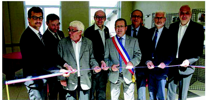
Tous les élus du territoire étaient présents pour cette inauguration

Outre l'aspect pratique pour les habitants, ce chantier a aussi permis de protéger et de mettre en valeur ce beau bâtiment de