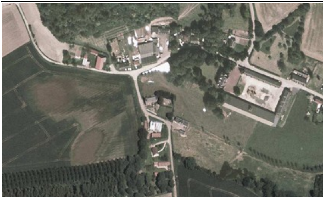
Illustration 4 : zone inondée par remontée de nappe dans la vallée de l'Enfer sur la commune de Fontaine-les-Cappy