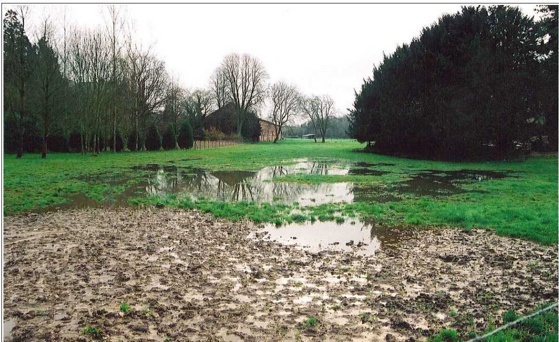
Illustration 2 : Nappe affleurante dans la vallée de l'Enfer sur la commune de Fontaine-les-Cappy