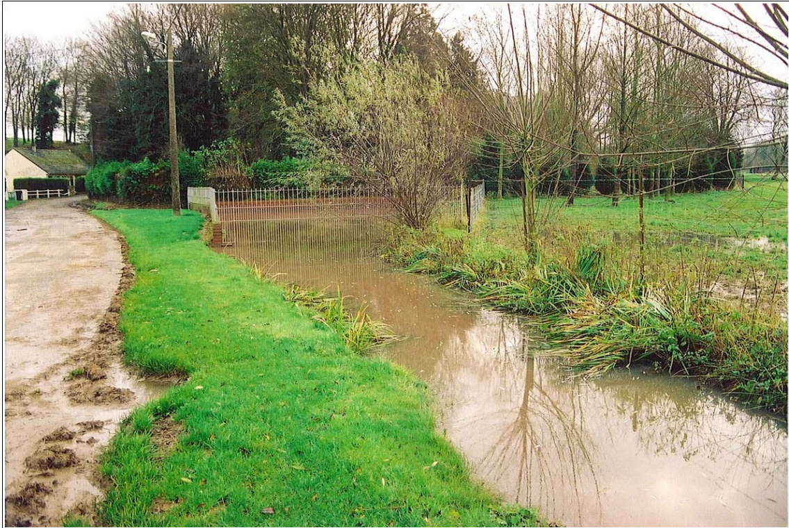
Illustration 1 : Emergence temporaire dans la vallée de l'Enfer sur la commune de Fontaine-les-Cappy