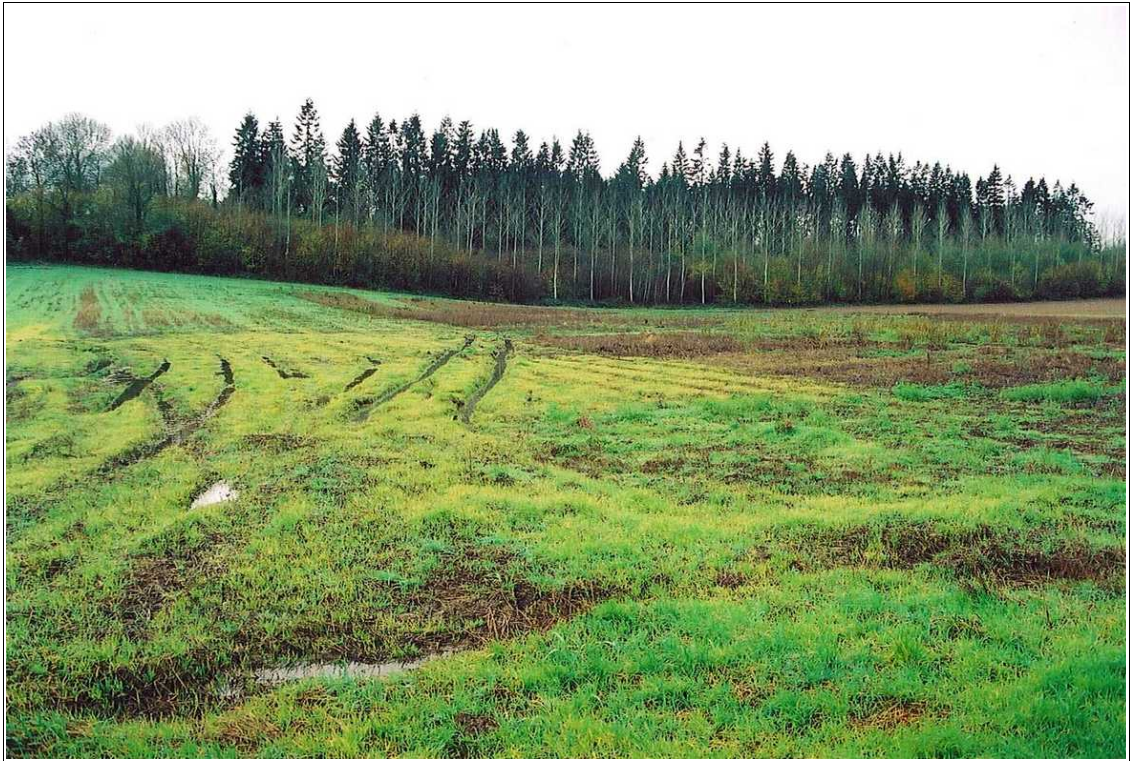
Illustration 3 : Nappe affleurante dans la vallée de l'Enfer sur la commune de Fontaine-les-Cappy