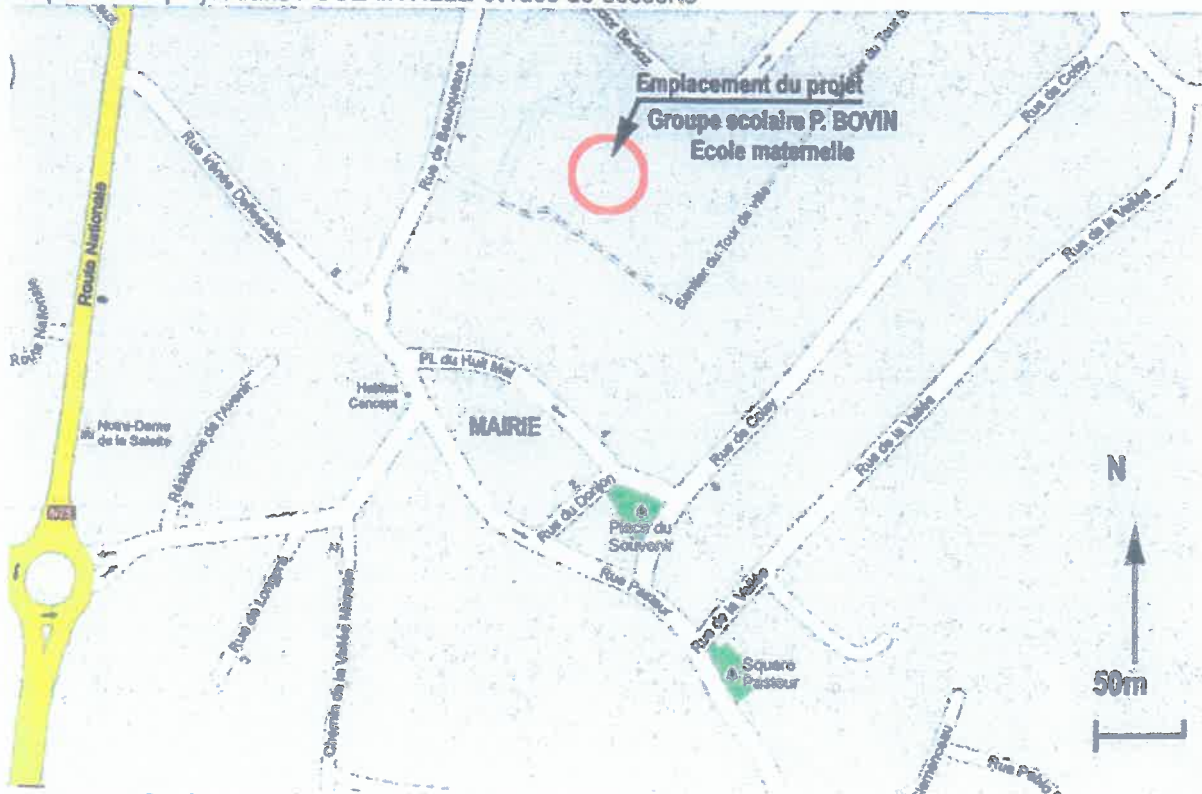
Situation proche du projet dans POULAINVILLE et rues de desserte

Le groupe scolaire Philippe Bovin est implanté en zone Ua du PLU, en cœur d'îlot, au centre de la commune. Il est en retrait de rues, et accessible par deux voies avec contrôle d'accès. Le groupe actuel est constitué par l'école primaire (4 classes), l'école maternelle (1 classe), une cantine scolaire et un centre de loisirs, l'ensemble s'articulant autour de la cour de récréation.