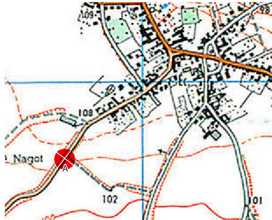
Carte de localisation du photomontage sur scan 25 (Sens de rotation du panorama : gauche à droite)