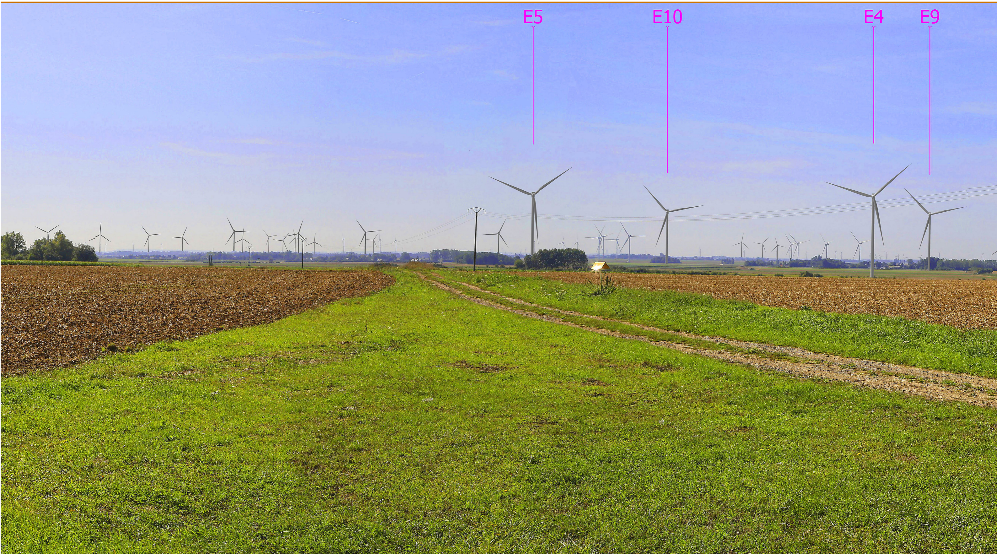
Photomontage représentant la perception terrain du projet en lisant l'image à une distance de 47,5 cm.