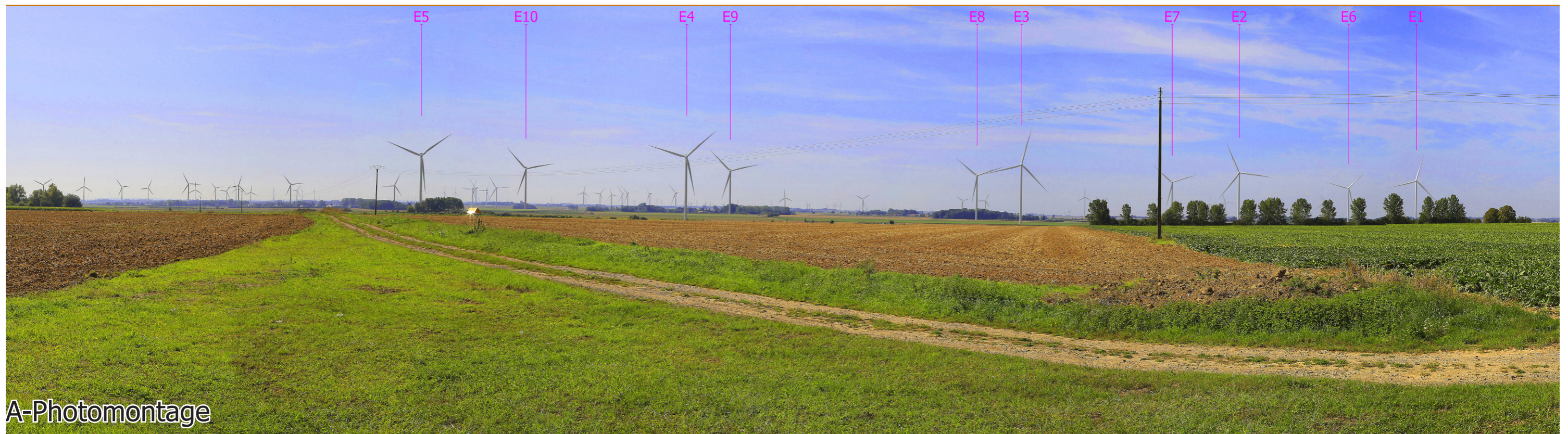
Photomontage - panorama à 90° (parcs existants, accordés, en instruction et projet)

En rose : projet étudié, En bleu : parcs existants, En vert : parcs accordés, En jaune : parcs en instruction et déposés