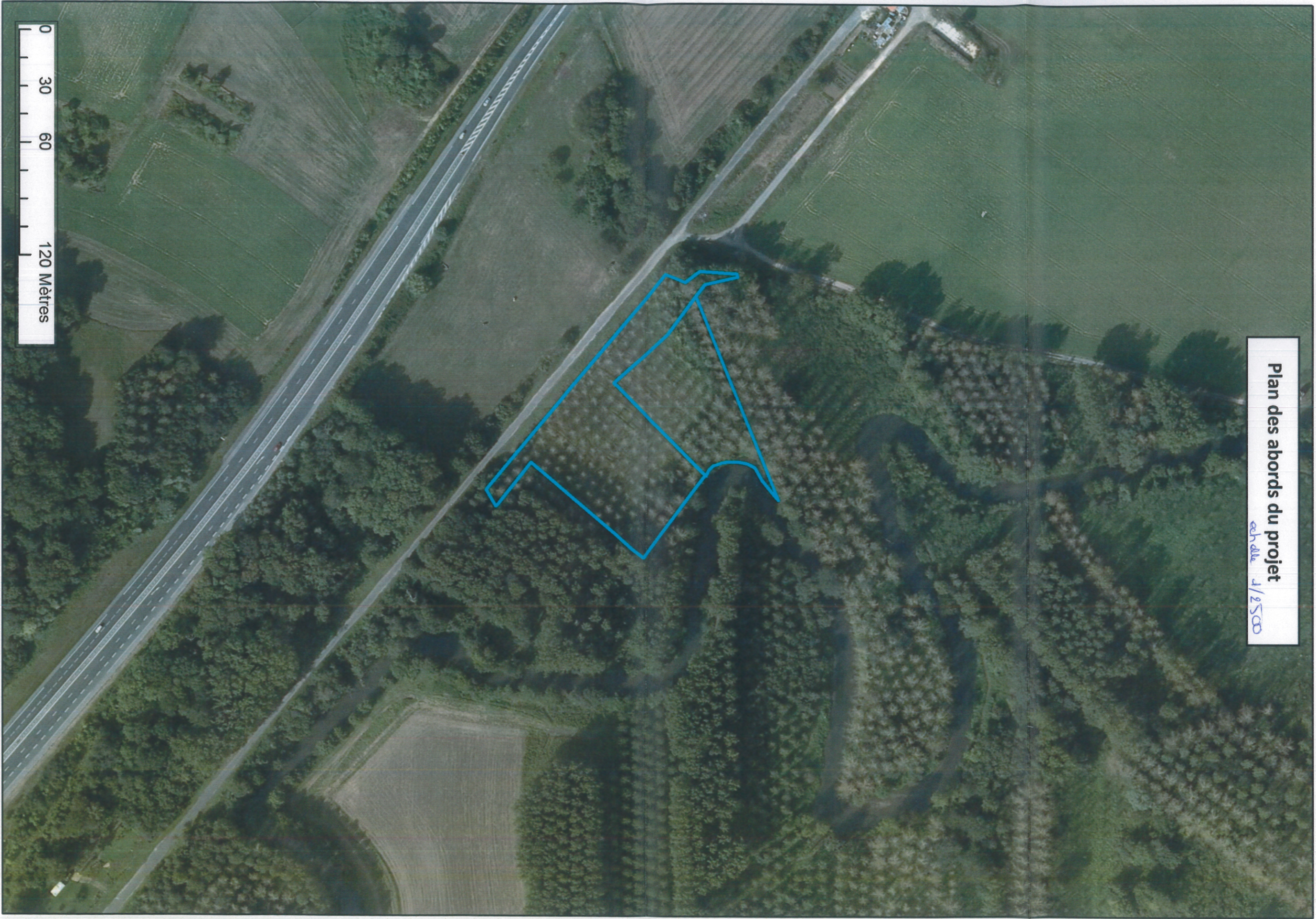
Plan des abords du projet échelle 1/2500