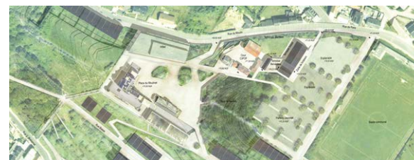
Quartier du Moulinet