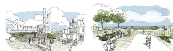
Projet d'imperméabilisation et réaménagement des espaces publics de Ault