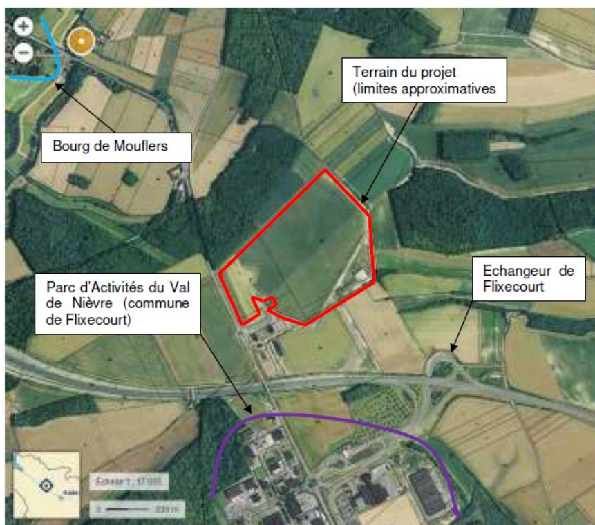
Localisation du projet