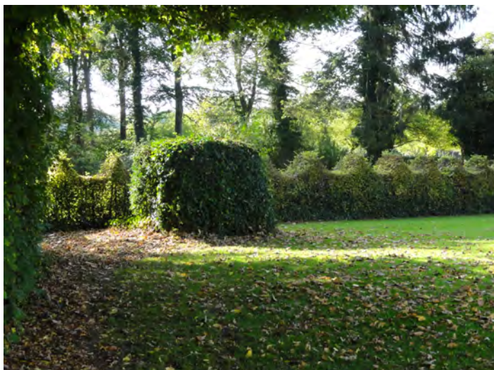
La souche en octobre 2019