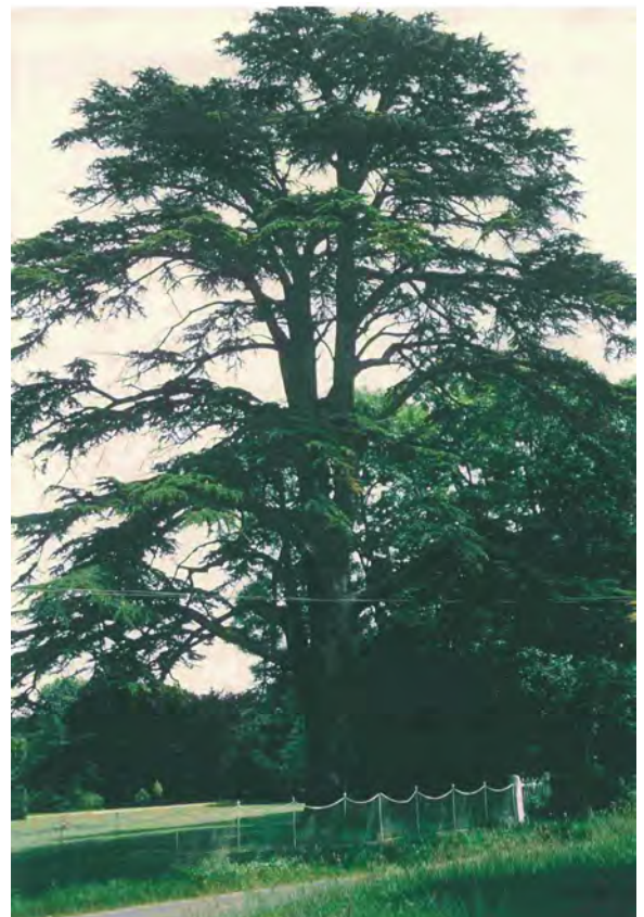
L'arbre en 1994