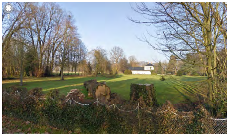
L'arbre sera abattu en février 2009