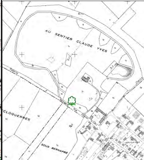
Extrait du cadastre