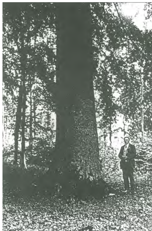
Emprise de l'arbre en 1934