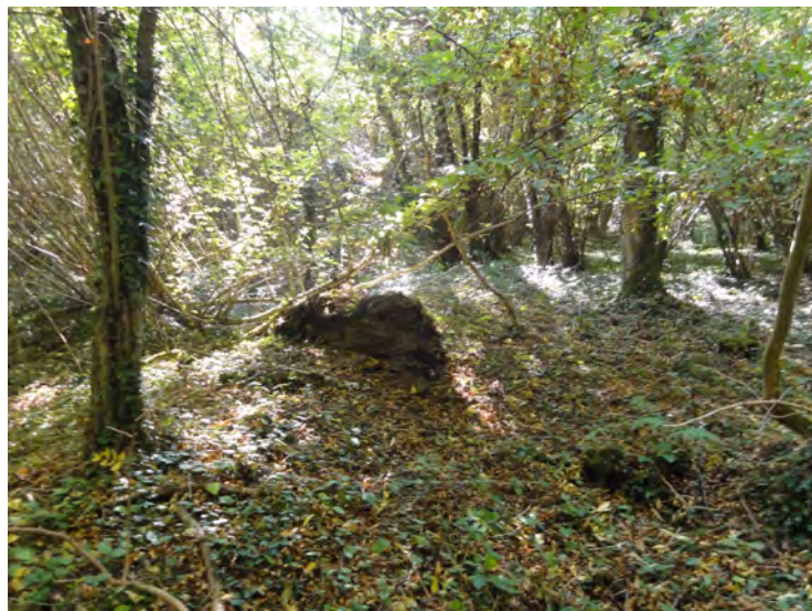
Le site en octobre 2019