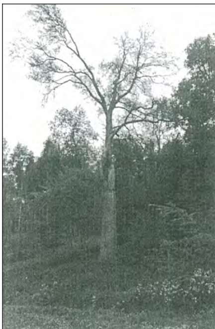
L'arbre en 1975