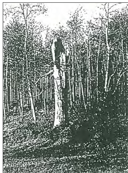
L'arbre en 1980