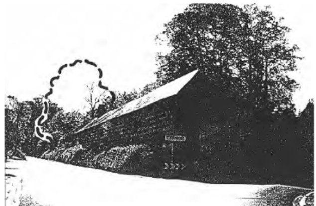
Emplacement de l'arbre abattu