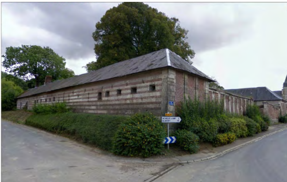
vue du domaine en 2019