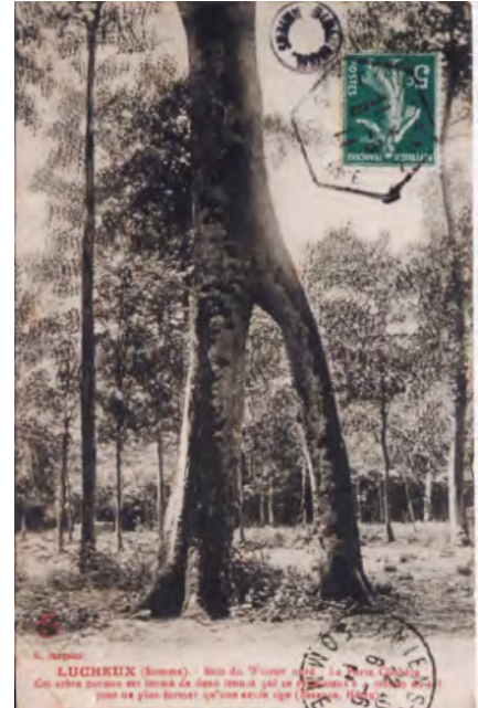
carte postale ancienne (1911 ? )