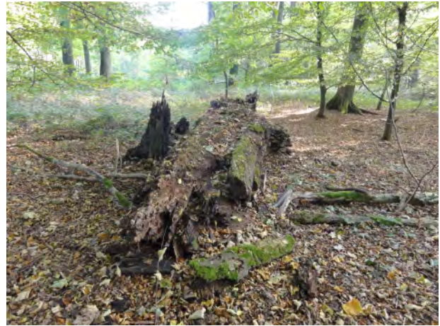
La souche de l'arbre en 2019