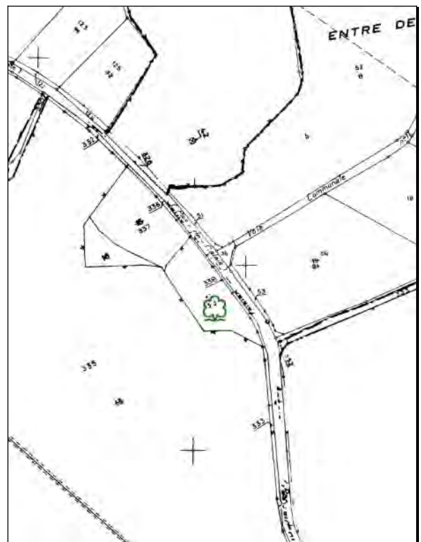
Extrait du cadastre