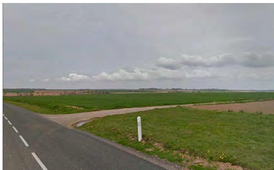
L'emplacement actuel du site (2019)