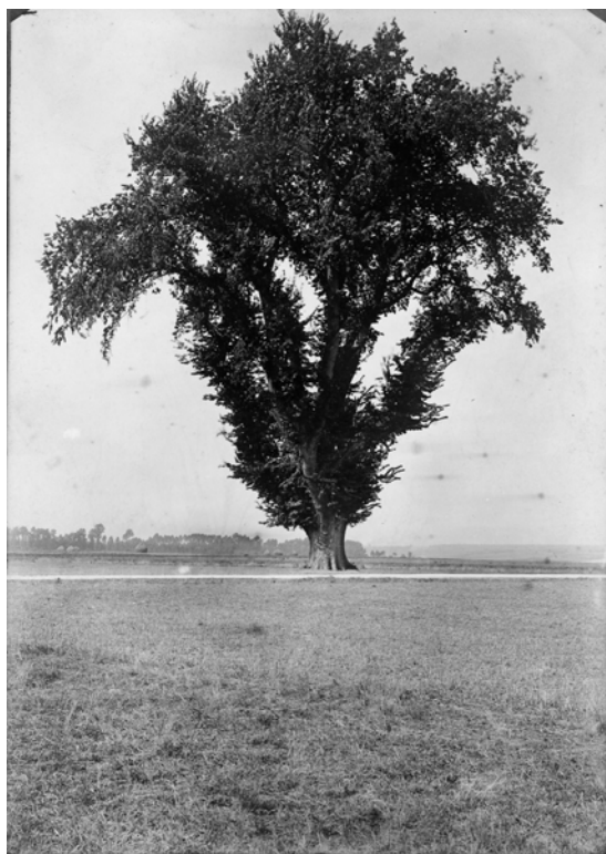
L'orme de Millencourt - Photo prise entre 1900 et 1913 (société des antiquaires de la Somme)