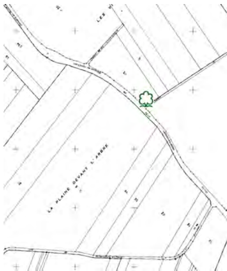
Extrait du cadastre

Symboliquement, un arbre a été replanté à proximité au début des années 2000 par la commune mais celui-ci a depuis totalement disparu.