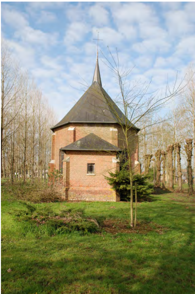
Le nouvel arbre replanté près de la chapelle (DIREN avril 2008)