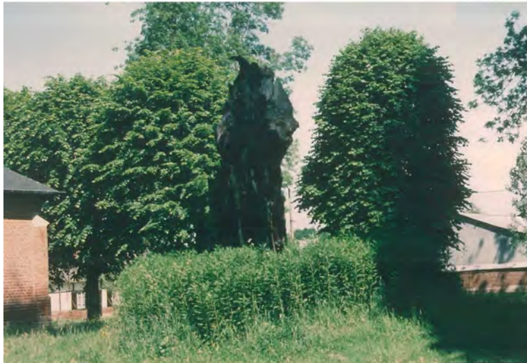
La souche de l'arbre en 1998