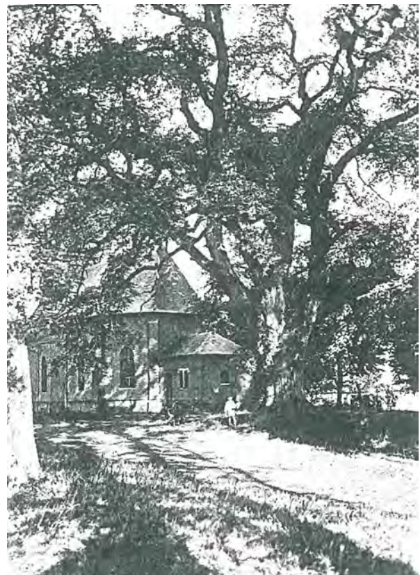
l'orme sur la place publique (document DIREN)