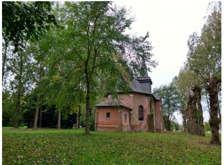
Le même en octobre 2019 (DREAL Hdf)