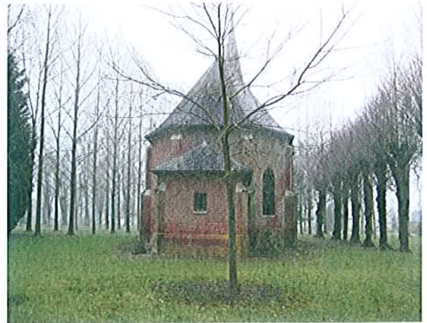
SITE DE MORVILLERS SAINT SATURNIN Orme sur la place du hameau de Digeon L'Orme a disparu et à été remplacé par un jeune arbre de même essence