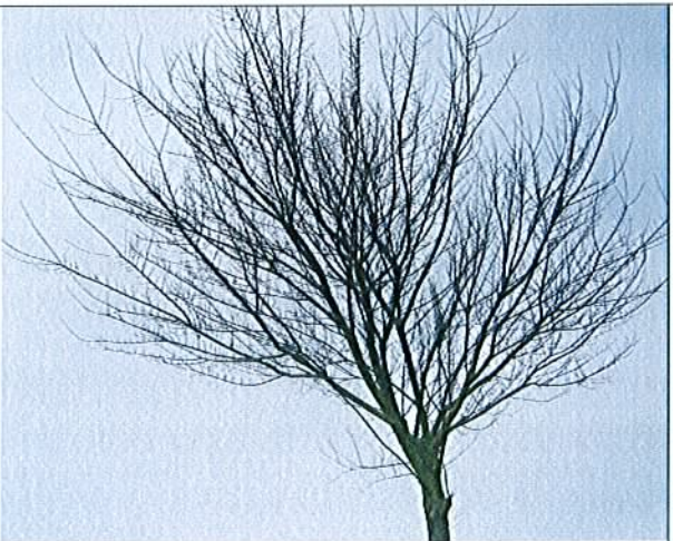
MILLENCOURT-en-PONTHIEU – Orme dit « l'arbre de belle vue » L'Orme a disparu et à été remplacé par un jeune arbre de même essence