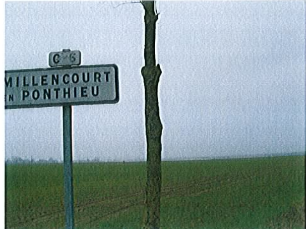
MILLENCOURT-en-PONTHIEU – Orme dit « l'arbre de belle vue » L'Orme a disparu et à été remplacé par un jeune arbre de même essence