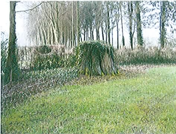
BERMESNIL – cèdre dans le parc du château Reste de la souche imposante du cèdre.