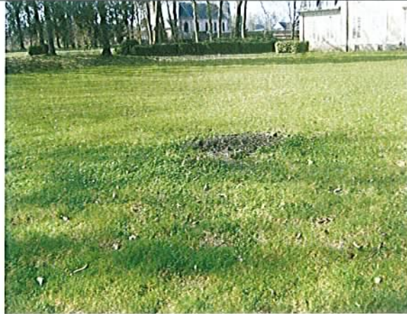
LOUVENCOURT – Hêtre Seul subsiste les traces d'une souche ancienne