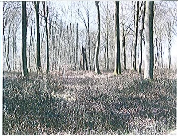
LUCHEUX – arbre curieux dit « la porte cochère » L'arbre est mort, subsiste le bas du tronc à deux jambes en état de pourrissement