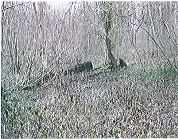
SITE DE CROIXRAULT Hêtre dit « la canne du bois » Le reste du tronc et la souche apparente voisine