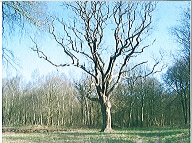
DOMPIERRE-sur-AUTHIE – Gros chêne dans une clairière L'arbre est encore présent, pour la plus grande partie dans un état de dépérissement avancé