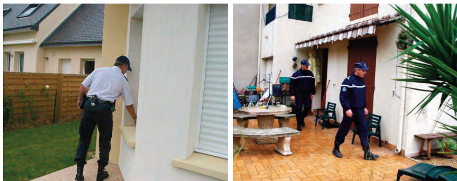
Policiers et gendarmes peuvent effectuer, tous les jours, des tournées de surveillance.

Si vous vous sentez isolé, menacé ou inquiet, faites-vous connaître auprès de la police ou de la gendarmerie : des patrouilles seront organisées.