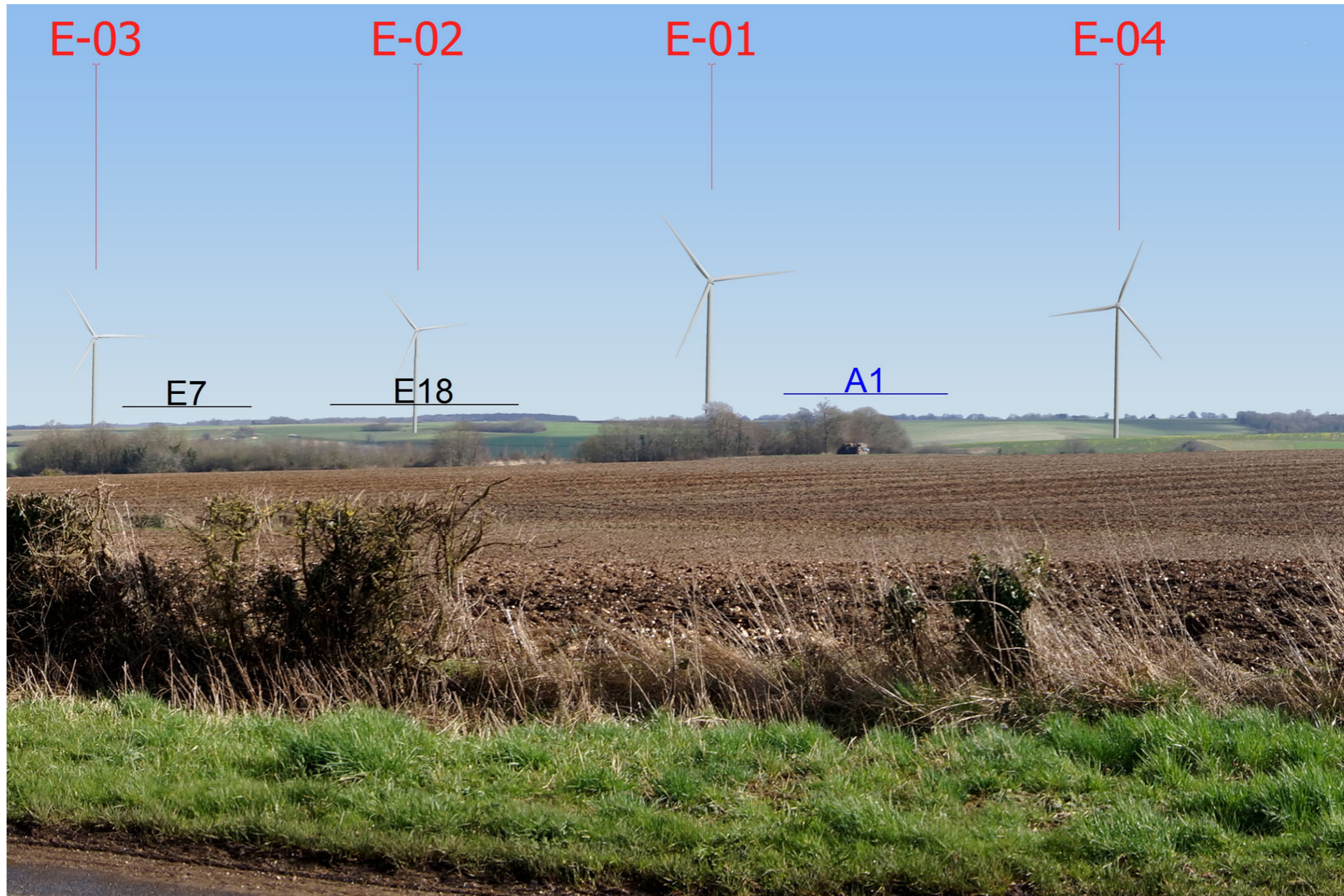
Variante 2 - Vue réelle, image 20 x 30 cm