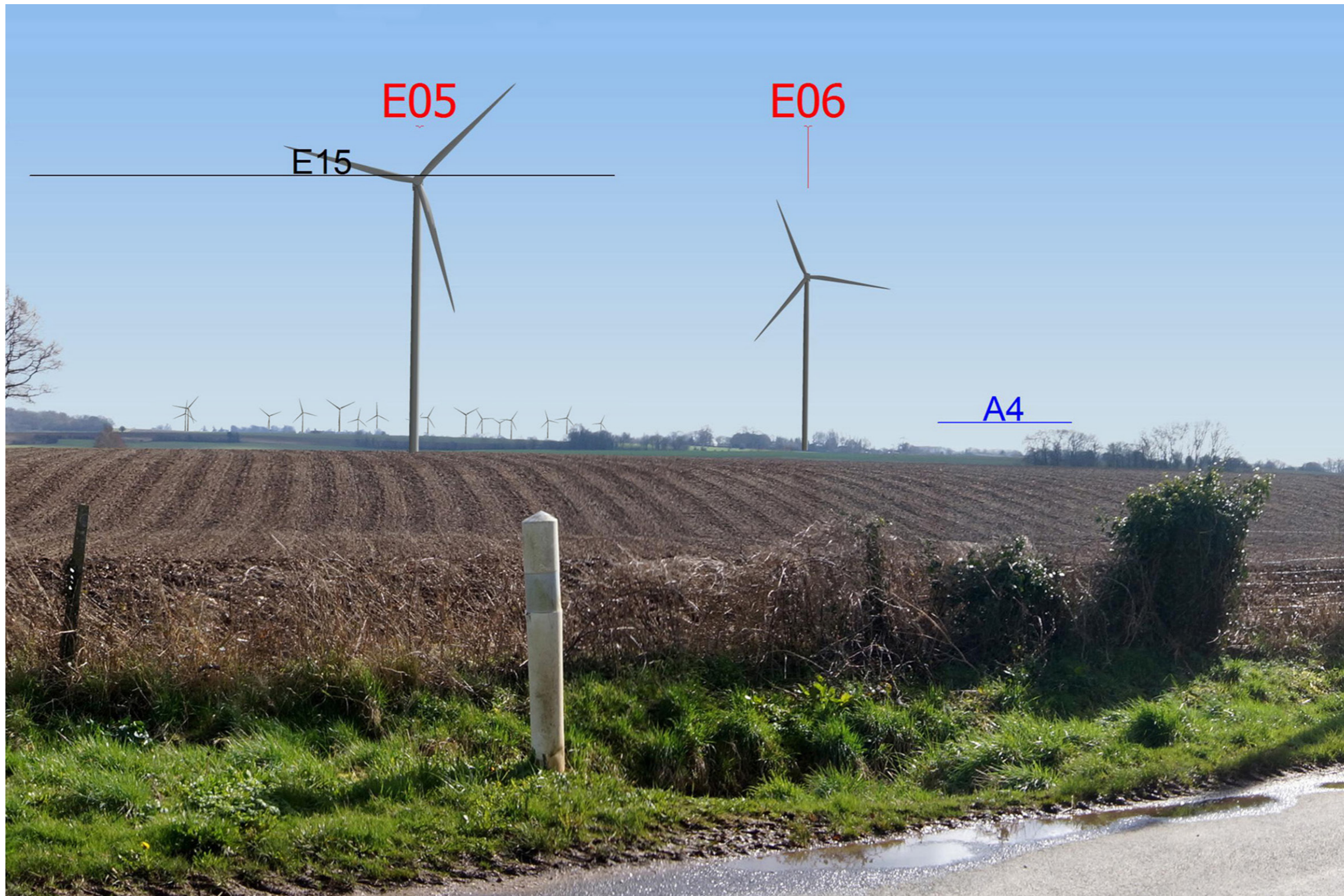
Variante 3 - Vue réelle, image 20 x 30 cm