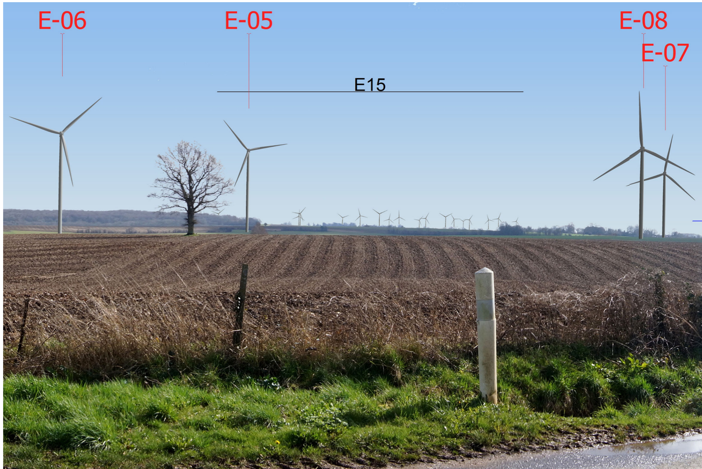
Variante 2 - Vue réelle, image 20 x 30 cm