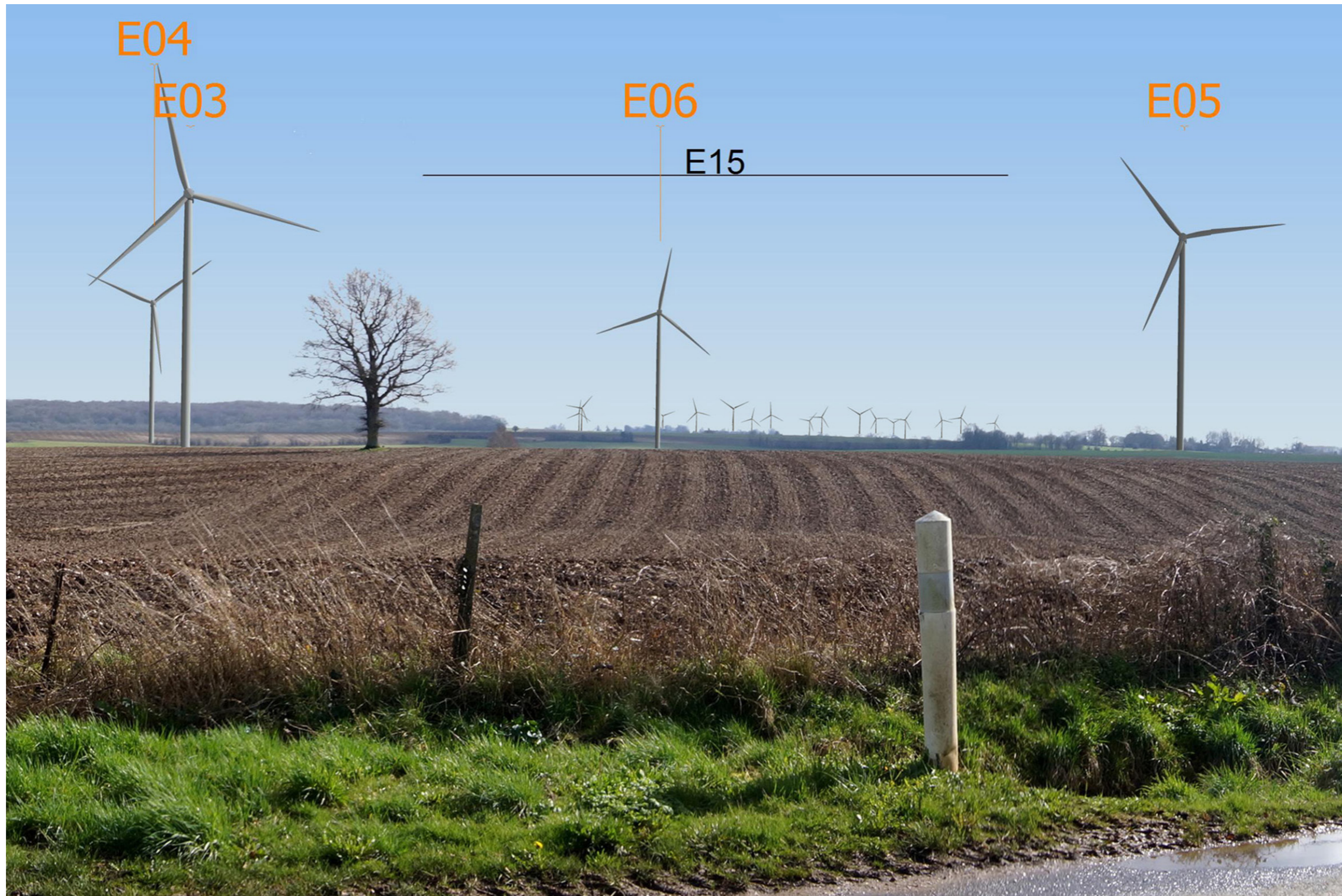
Variante 1 - Vue réelle, image 20 x 30 cm