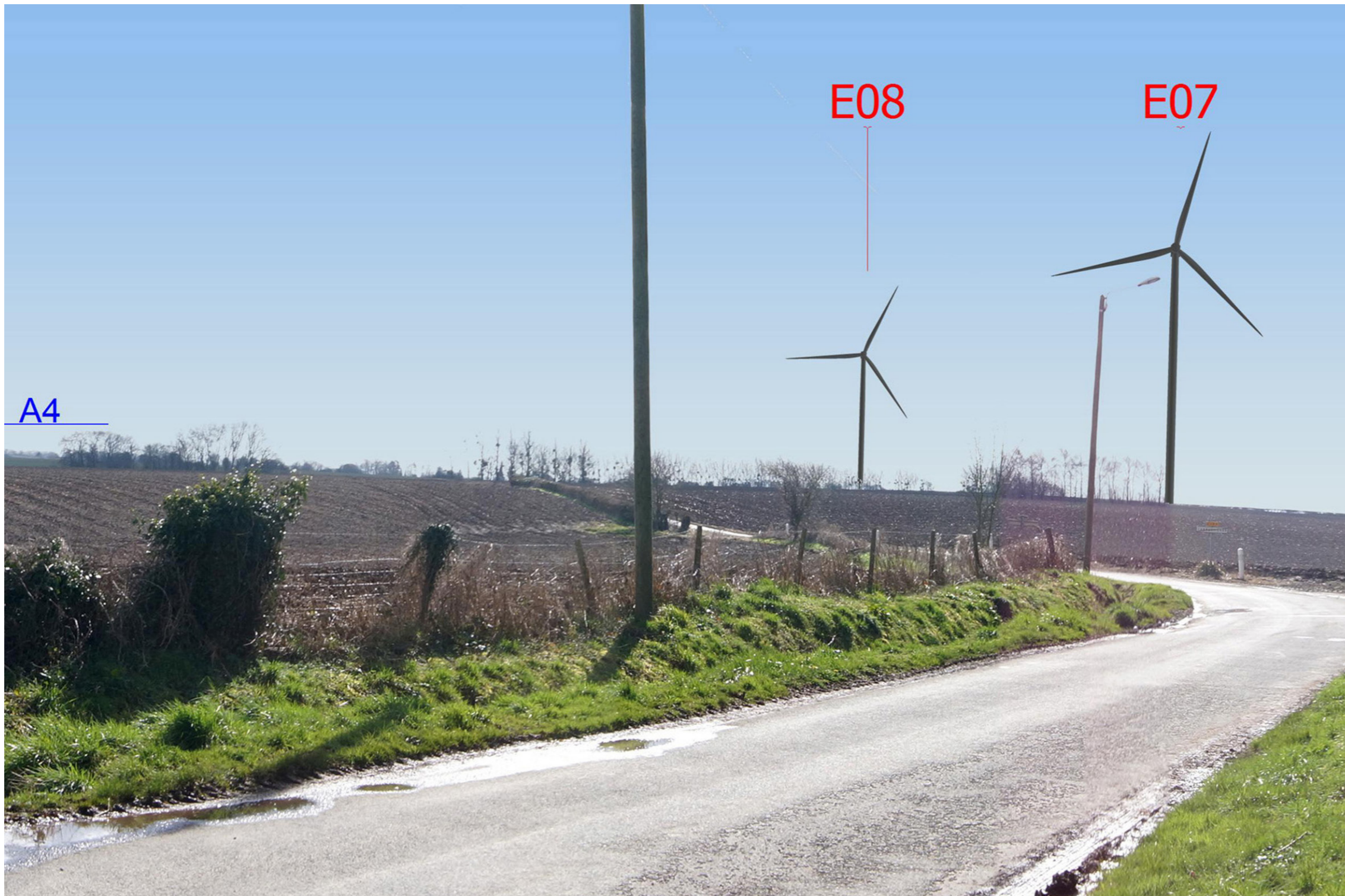
Variante 3 - Vue réelle, image 20 x 30 cm