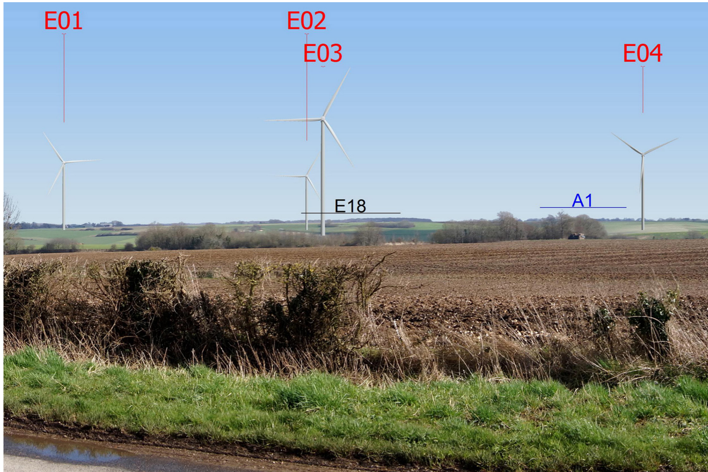
Variante 3 - Vue réelle, image 20 x 30 cm