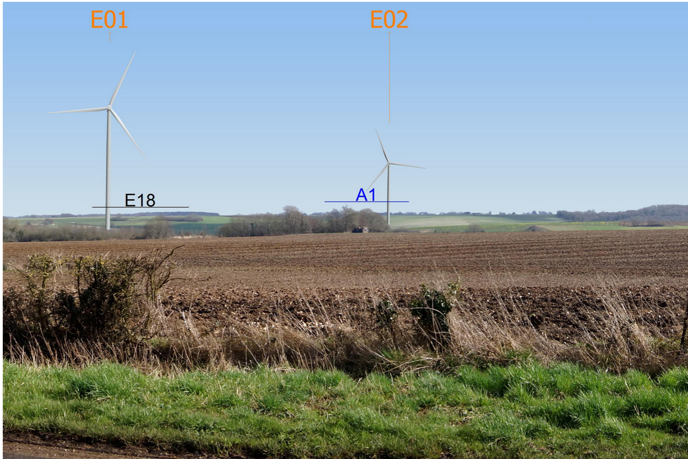
Variante 1 - Vue réelle, image 20 x 30 cm