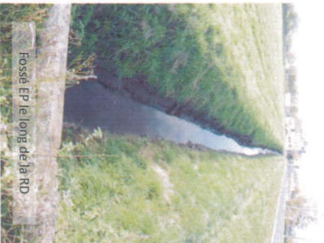
Fossé EP le long de la RD