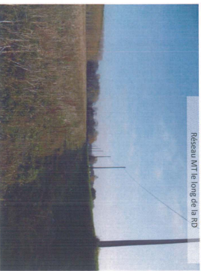
Réseau MT le long de la RD