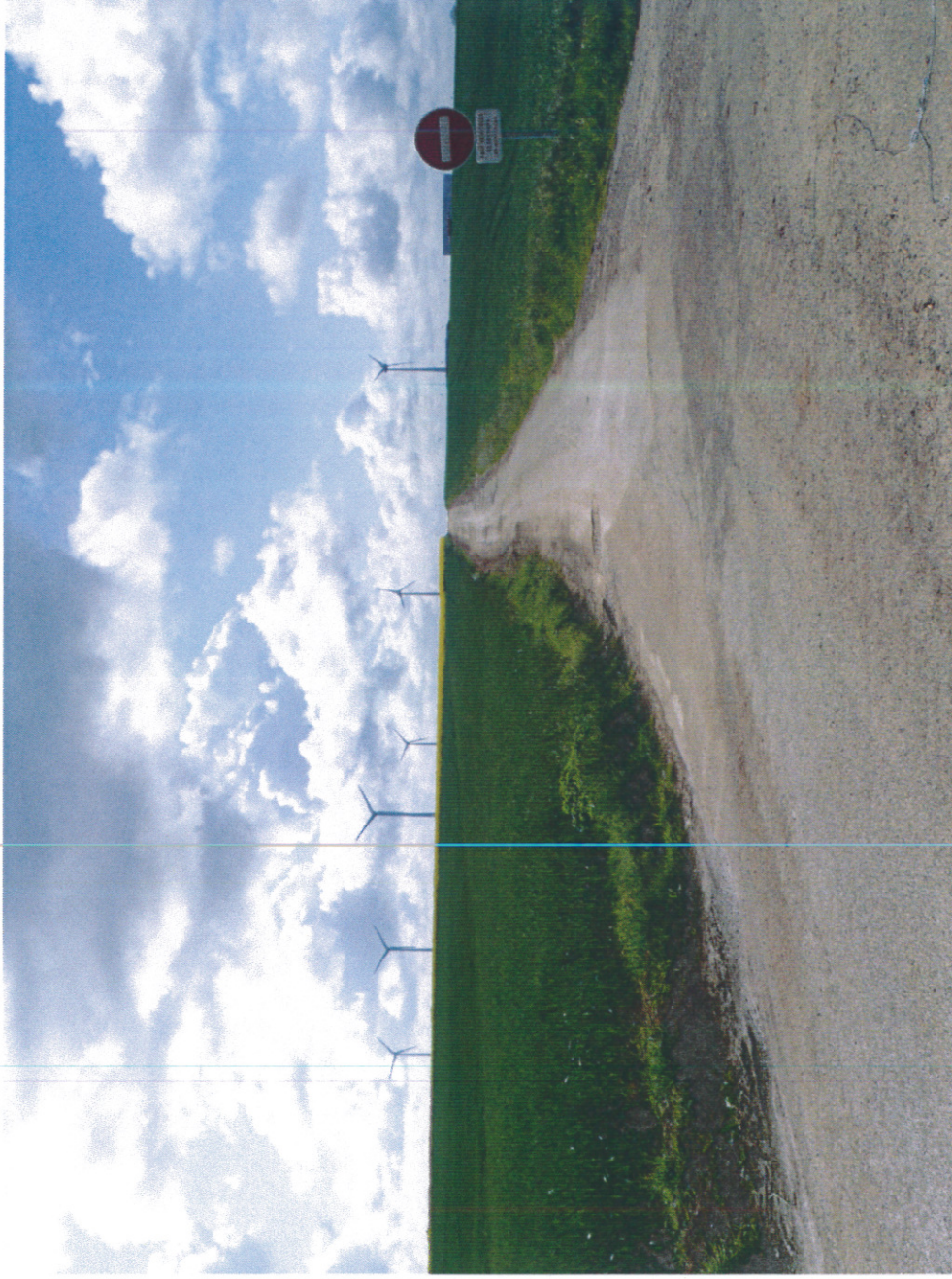
Photographie 1 : Situation du projet