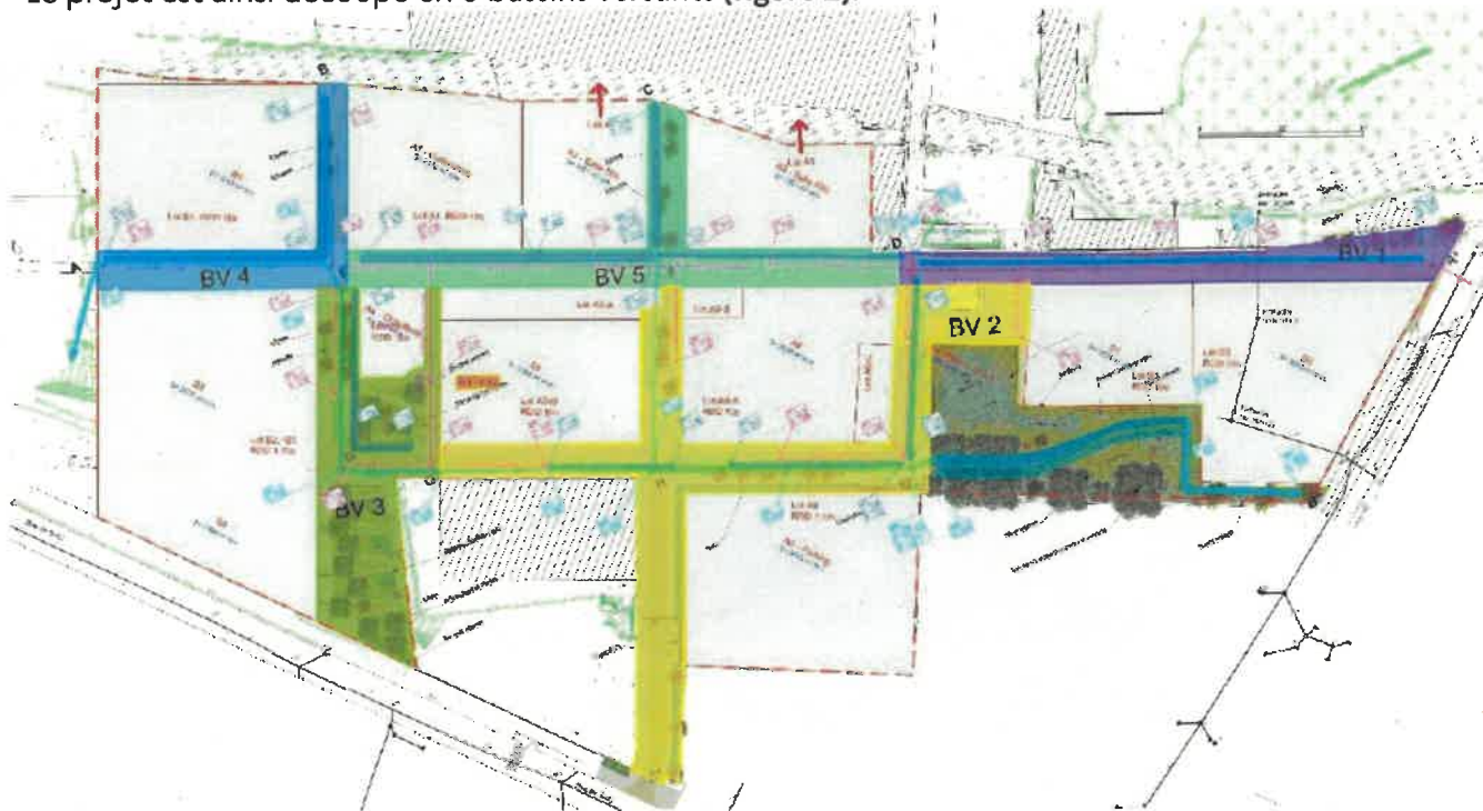
Figure 2: plan de gestion des eaux pluviales

Le projet est ainsi découpé en 5 bassins versants (figure 2).